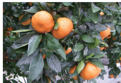
収穫時期の果実の様子