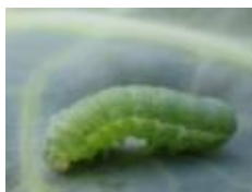
シロイチモジヨトウ